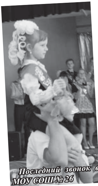
Последний звонок в МОУ СОШ № 26

Школьные годы пролетели, как один день... Для выпускников уже прозвучал последний звонок. В этом году «путёвку во взрослую жизнь» получили 582 орехово-зுவских школьника.