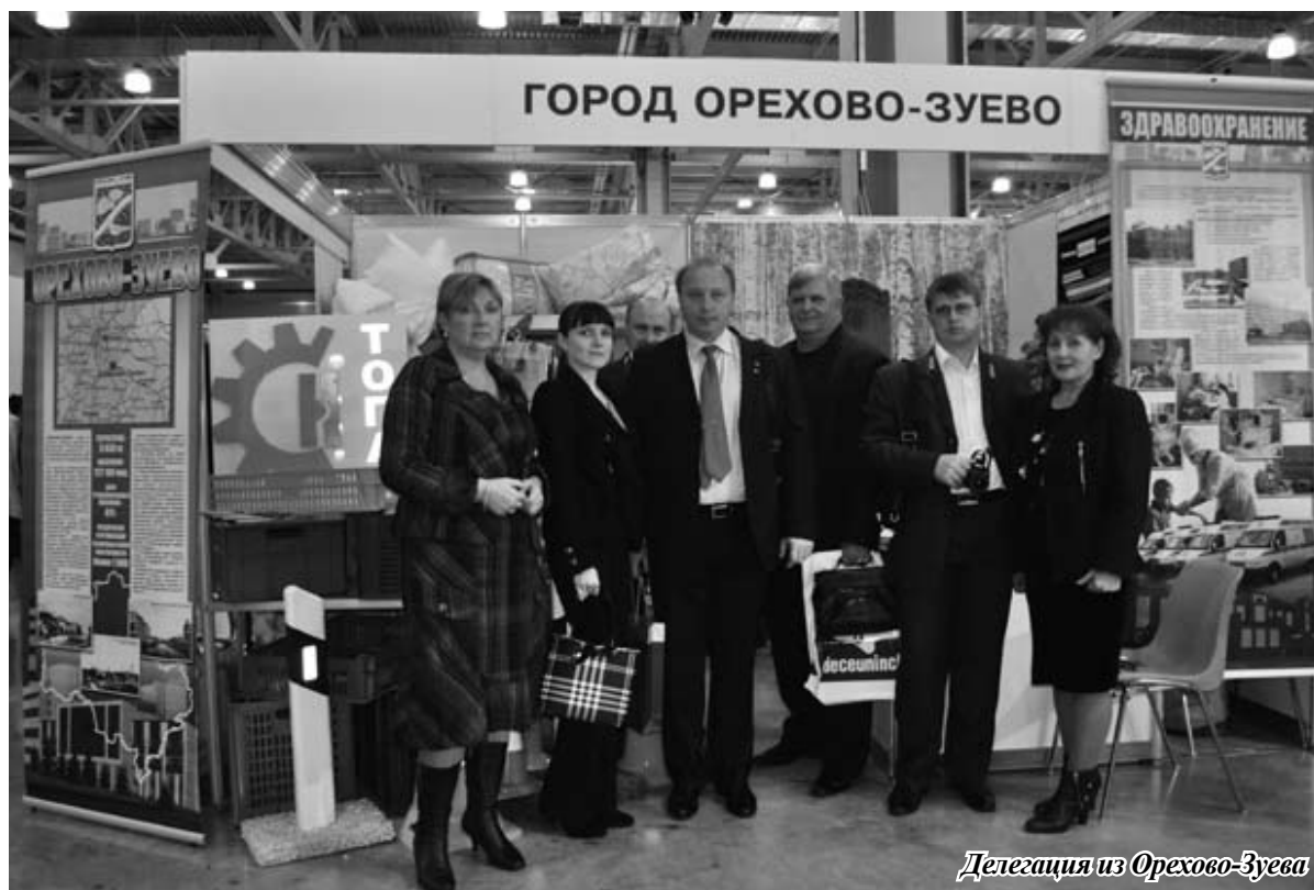
Делегация из Орехово-Зуева