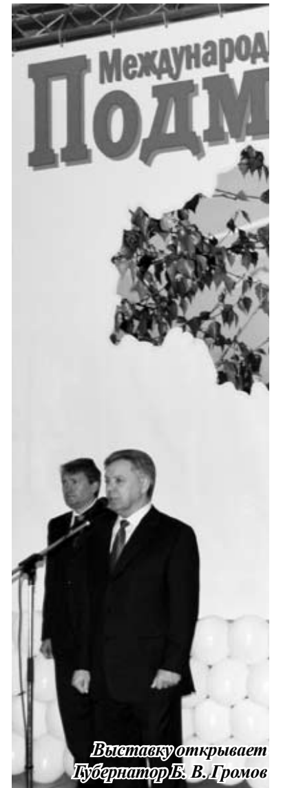
Выставку открывает Губернатор Б. В. Громов