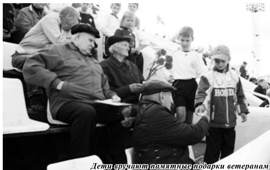
Дети вручают памятные подарки ветеранам