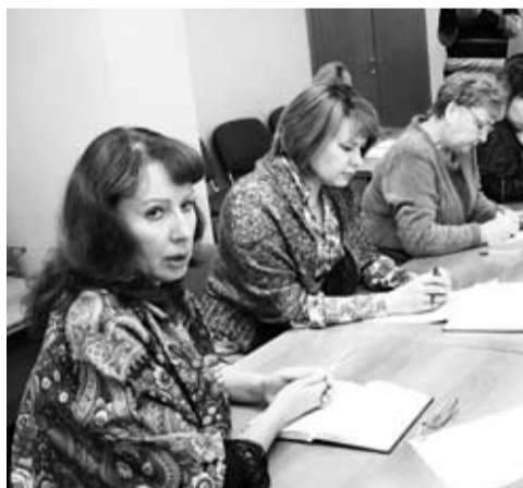
Во время заседания