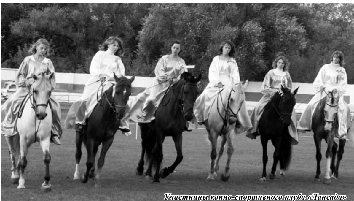
Участницы конно-спортивного клуба «Лансада»