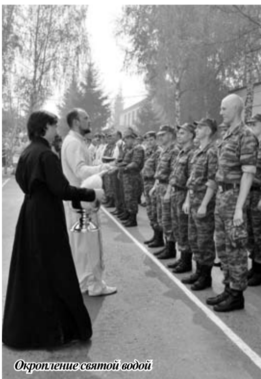
Окропление святой водой