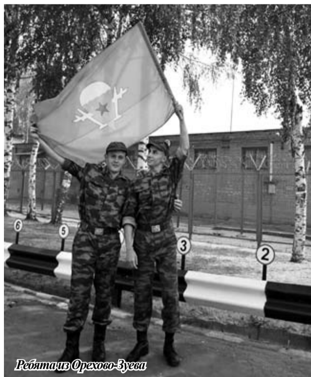
Ребята из Орехово-Зуева

Этот год для Воздушно-десантных войск – юбилейный. 80 лет назад, 2 августа 1930 года на учениях Военно-воздушных сил Московского военного округа под Воронежем было десантировано на парашютах подразделение в составе 12-ти человек. А уже через 3 года были сформированы авиационные батальоны особого назначения в Белорусском, Украинском, Московском и Приволжском военных округах.