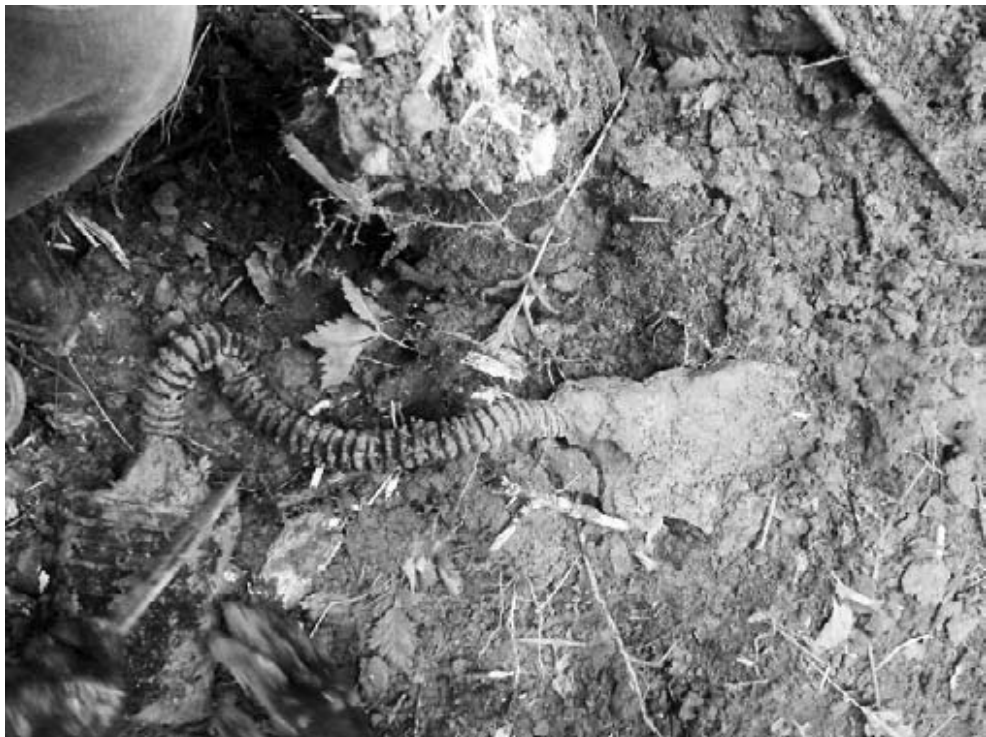
Извлечение из земли противогаза