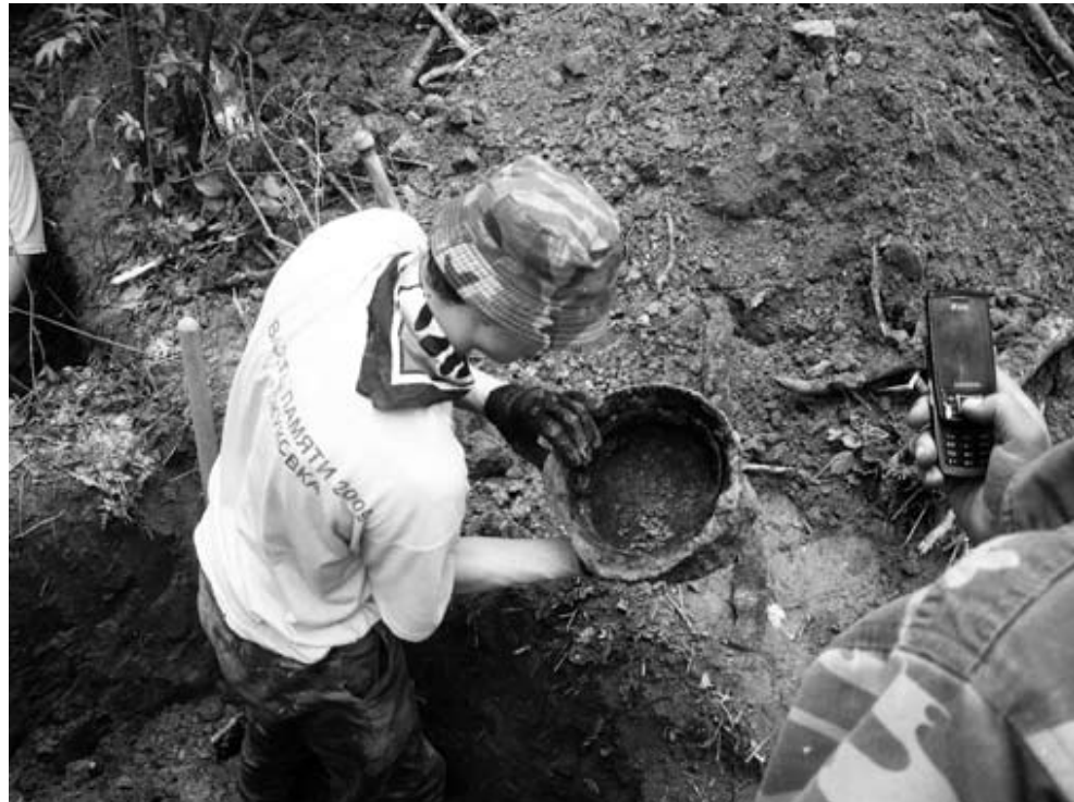
Находка - каска красноармейца