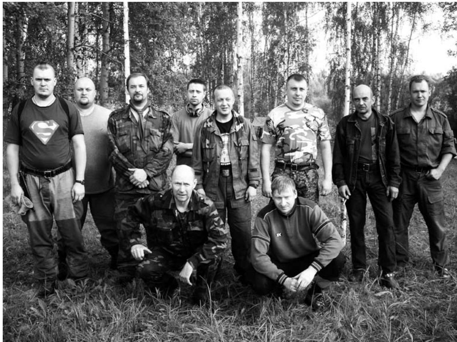
Группа поисковиков на раскопках в Брянской области

Однако стоит отметить, что ведение раскопок предполагает не только умение орудовать лопатой. Это действительно серьёзная работа, и прежде чем приступить к ней, необходимо пройти обучение по соответствующей программе, куда включены